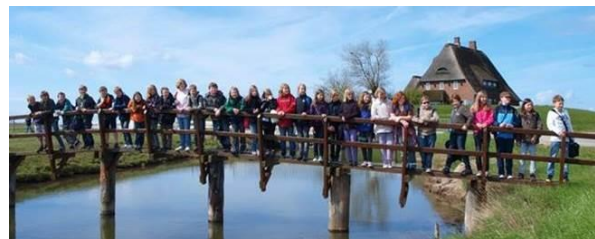
Plattdeutsch-Klasse Gymnasium Warstade, Hemmoor